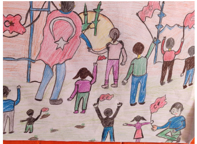
Rukiye Nur Şenel 6/F