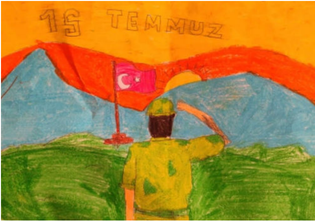
İhsan Ören 7/A