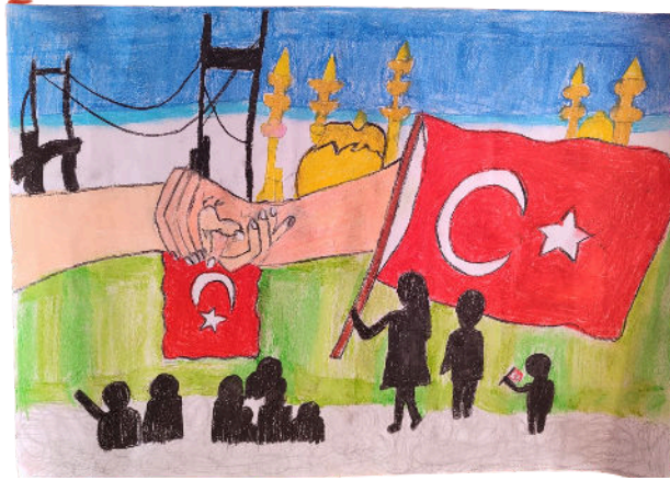
Zeynep Kibar 7/A